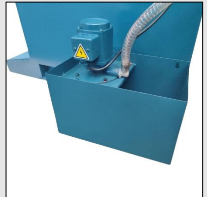
Equipo de refrigeración