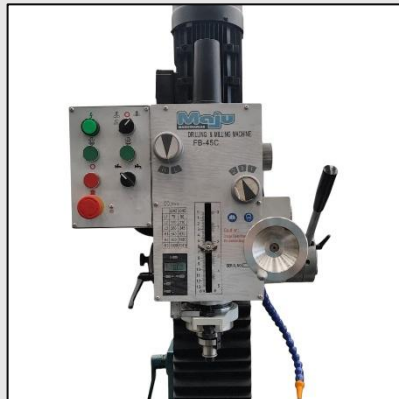
Bajada automática de husillo y regla digital