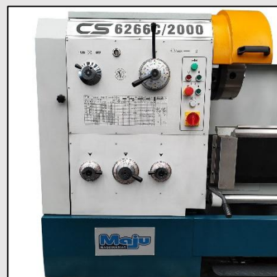
Coja Norton integrada