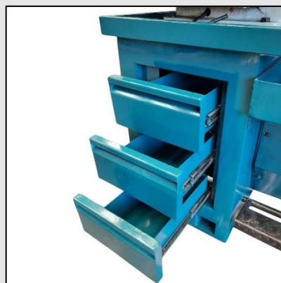
Base de fundición de hierro.